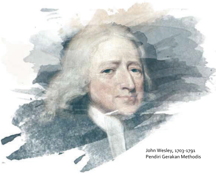
John Wesley, 1703-1791 Pendiri Gerakan Methodis