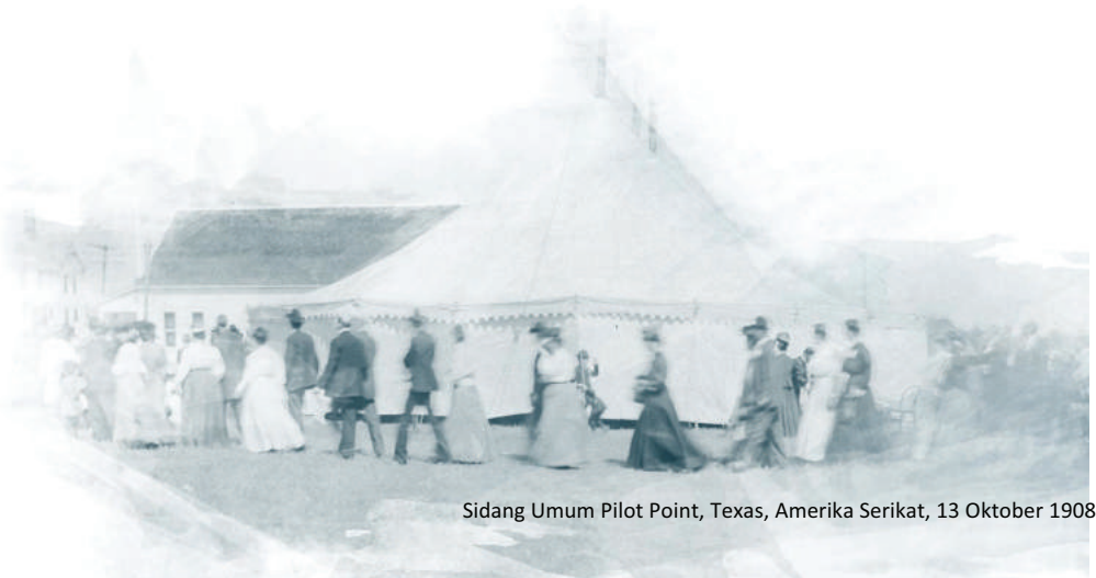
Sidang Umum Pilot Point, Texas, Amerika Serikat, 13 Oktober 1908

Pada bulan Oktober 1907, Asosiasi Gereja-Gereja Pentakosta Amerika dan Gereja Kristen Nazarene bersama-sama bersidang di Chicago, Illinois, untuk merancang aturan mengenai pola pemerintahan gereja yang menyeimbangkan otoritas para ketua/pemimpin dengan hak jemaat. Ketua-ketua ada untuk mengembangkan dan merawat gereja-gereja yang telah didirikan, mengatur dan mendorong gereja-gereja baru, namun tidak menginterferensi urusan dalam gereja yang terorganisir sepenuhnya.