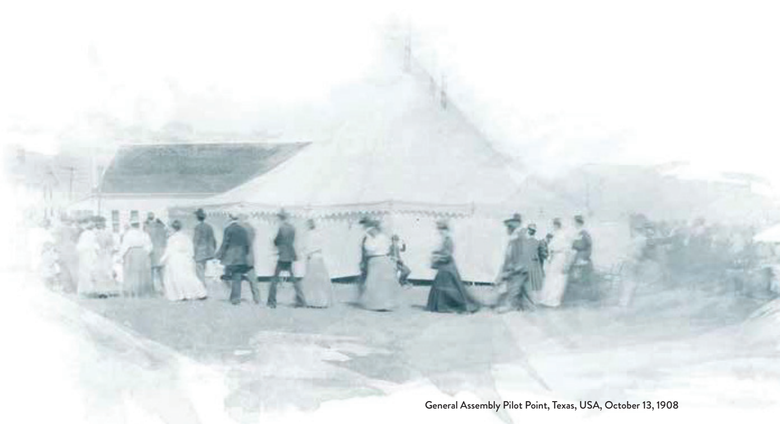
General Assembly Pilot Point, Texas, USA, October 13, 1908

Ang ika-lima nga General Assembly (1919) nagbag-o sa opisyal nga ngalan sa denominasyon ngadto sa Church of the Nazarene. Ang pulong nga “Pentecostal” wala na nasusama sa holiness doctrine sama kaniadto sa ulahing bahin sa ika-19 nga siglo sa panahon nga ang mga founder ang nag-adopt sa orihinal nga ngalan sa simbahan. Ang batan-ong denominasyon nagpabilin nga matuod sa orihinal nga misyon sa pagsangyaw sa ebanghelyo sa hingpit nga kaluwasan.