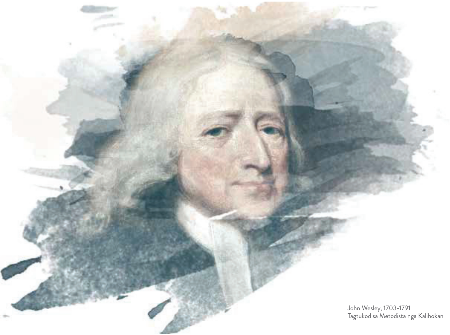
John Wesley, 1703-1791 Tagtukod sa Metodista nga Kalihokan