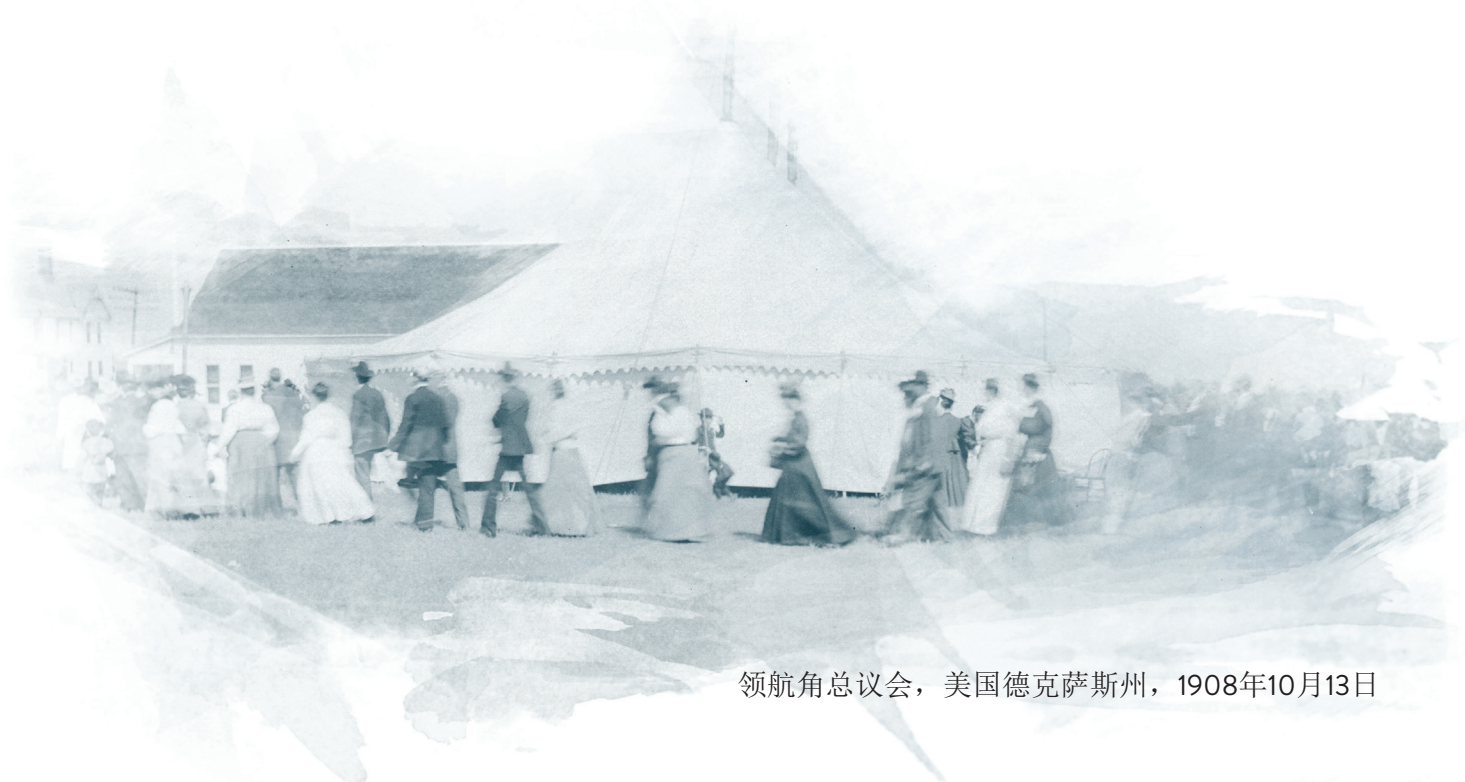
领航角总议会，美国德克萨斯州，1908年10月13日

当教会创立者们于19世纪晚期最早使用“五旬节”一词作为教会名称时，其含义等同于圣洁教义，然而后来，“五旬节”一词不再是“圣洁”的同义词。第五届总议会（1919年）将宗派的正式名称改为宣圣会。这一年轻的宗派坚守其传扬全备救赎之福音的原初使命。