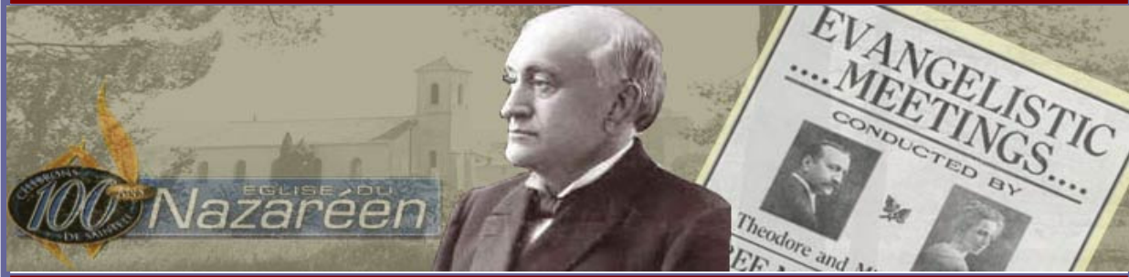
Célébration du centenaire 1908 - 2008